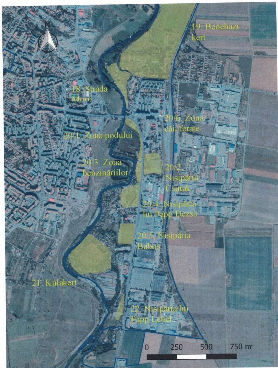
Plan de situație cu reglementările propuse pentru Planul Urbanistic General al Municipiului Sfântu Gheorghe – zona estică a orașului