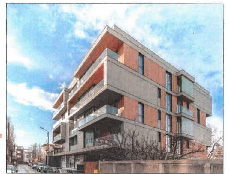
Ilustrare volumetrica orientativa - constructii propuse